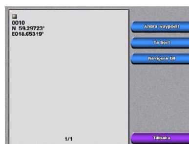
Skärmbilden Skapa waypoint