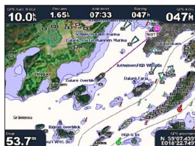
Gå till destination