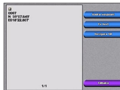
Ändra eller ta bort en waypoint