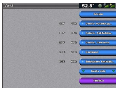
Lista över marina servicealternativ