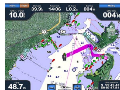
Instruktioner till (BlueChart g2 Vision)